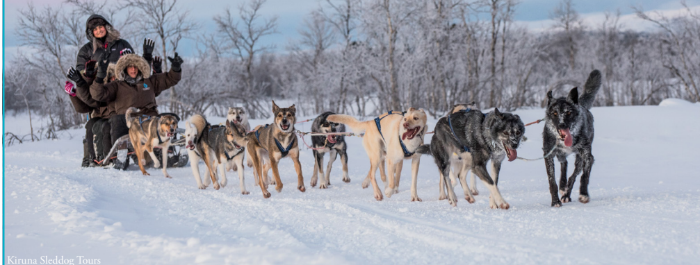
Kiruna Sleddog Tours